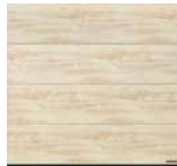
28 Used Look (design patiné)