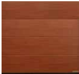
17 Cherry (cerisier)