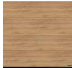
19 Malt Oak (chêne malte) .NOUVEAU