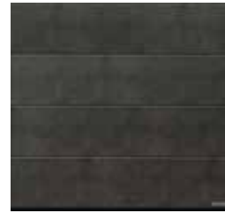
10 Grigio scuro (gris foncé)