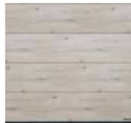
38 Whitewashed Oak (chêne chaulé)