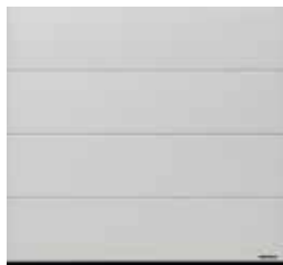
34 White brushed (brossé blanc)