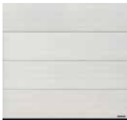
35 White Oak (chêne blanc)