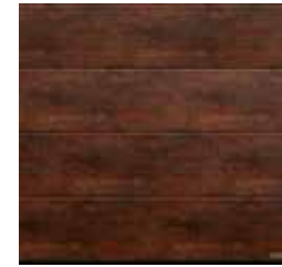
12 Rusty Steel (acier rouillé)