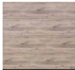
36 Whiteoiled Oak (chêne huilé blanc)