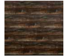
14 Burned Oak (chêne brûlé)