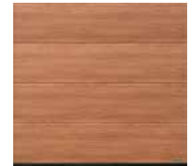
22 Noce Sorrento Natur (Noyer Sorrento Naturel)