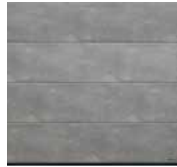
8 Grigio (gris)