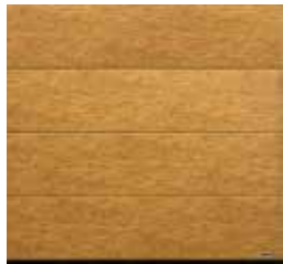
16 Bambus (bambou)