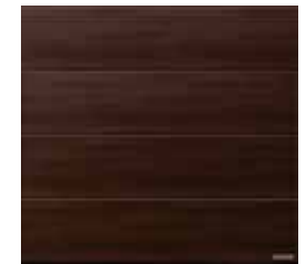
33 Walnuss Terra (noyer)